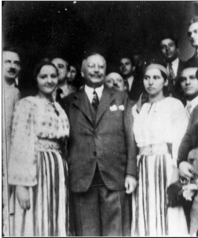
Dimitrie Gusti la Belinț, în 1934, în mijlocul membrilor echipei sociologice a Institutului Social Banat-Crișana și al țăranilor